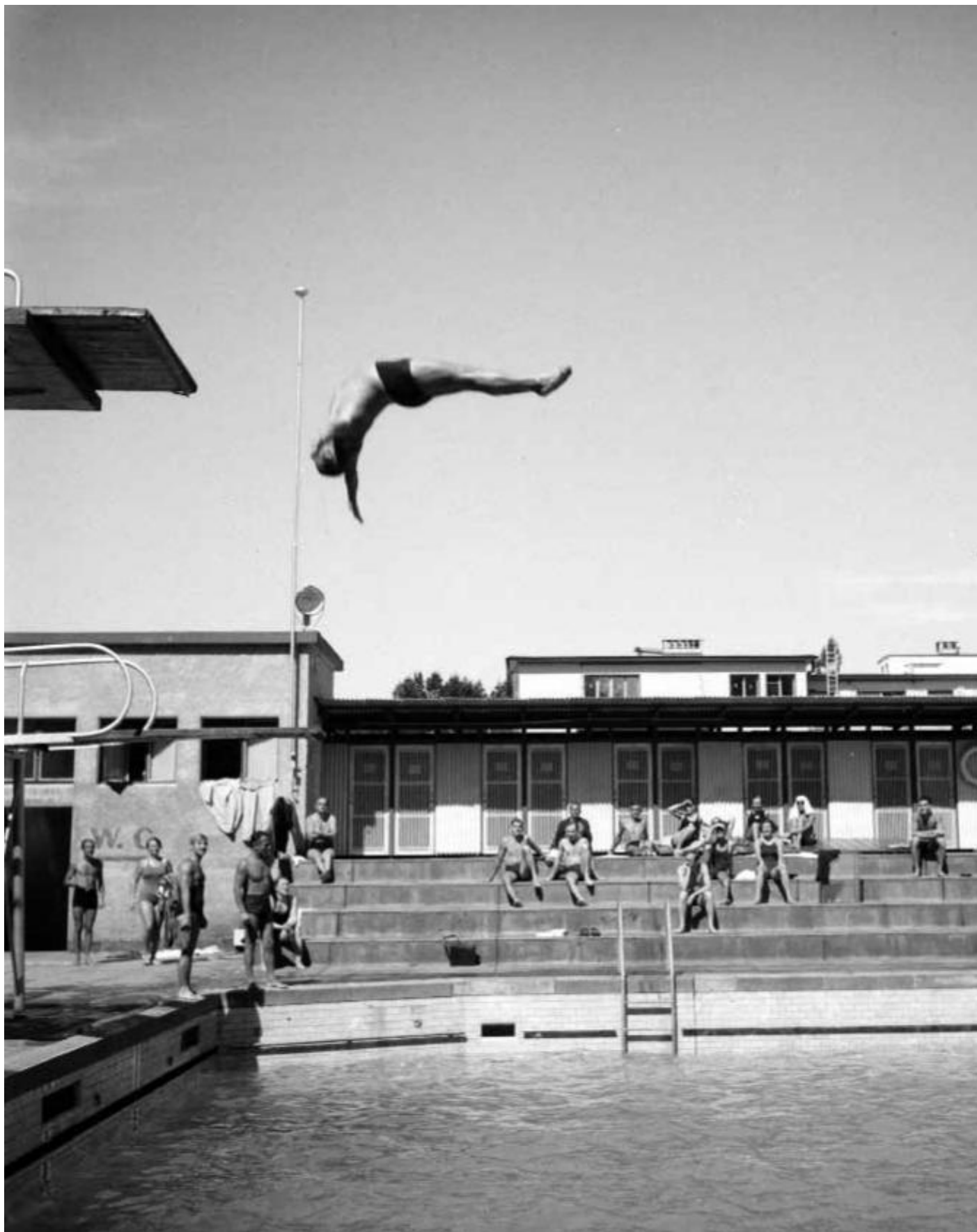
Plongeur de haut-vol à la piscine Ka-We-De ver 1945