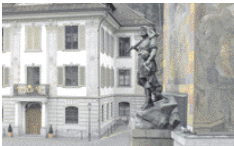
Statue de Guillaume Tell sur la place de l'Hôtel-de-Ville d'Altdorf